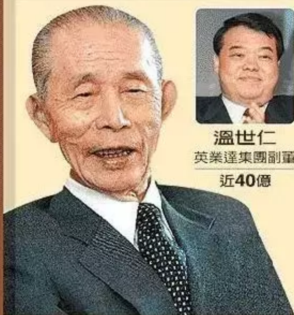
王永慶 台塑集團創辦人 100多億