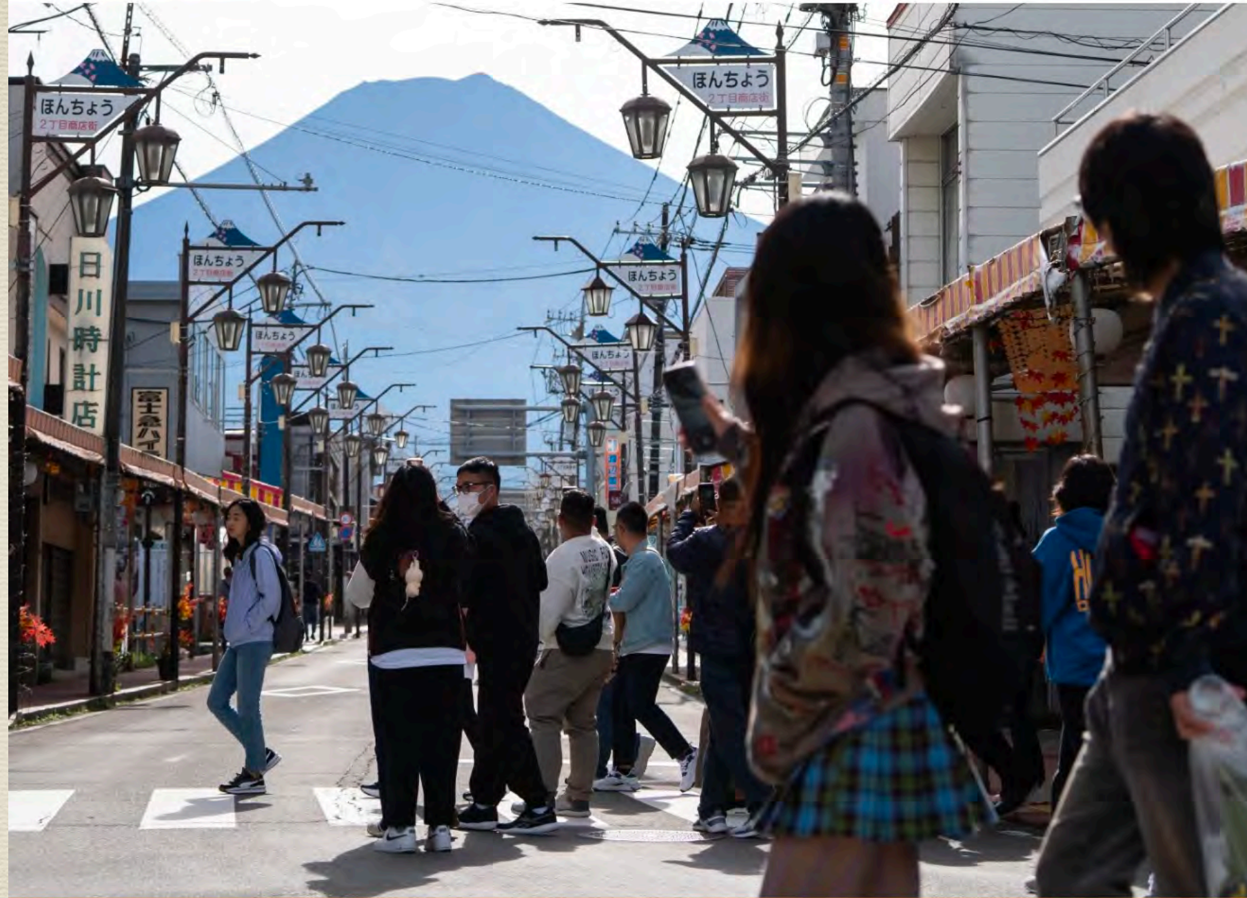
富士山是日本著名景點。

日本出入國在留管理廳上周五（24日）公布，去年外國人入境人數（初值）約3,678萬人次，創下自1950年有紀錄以來新高。