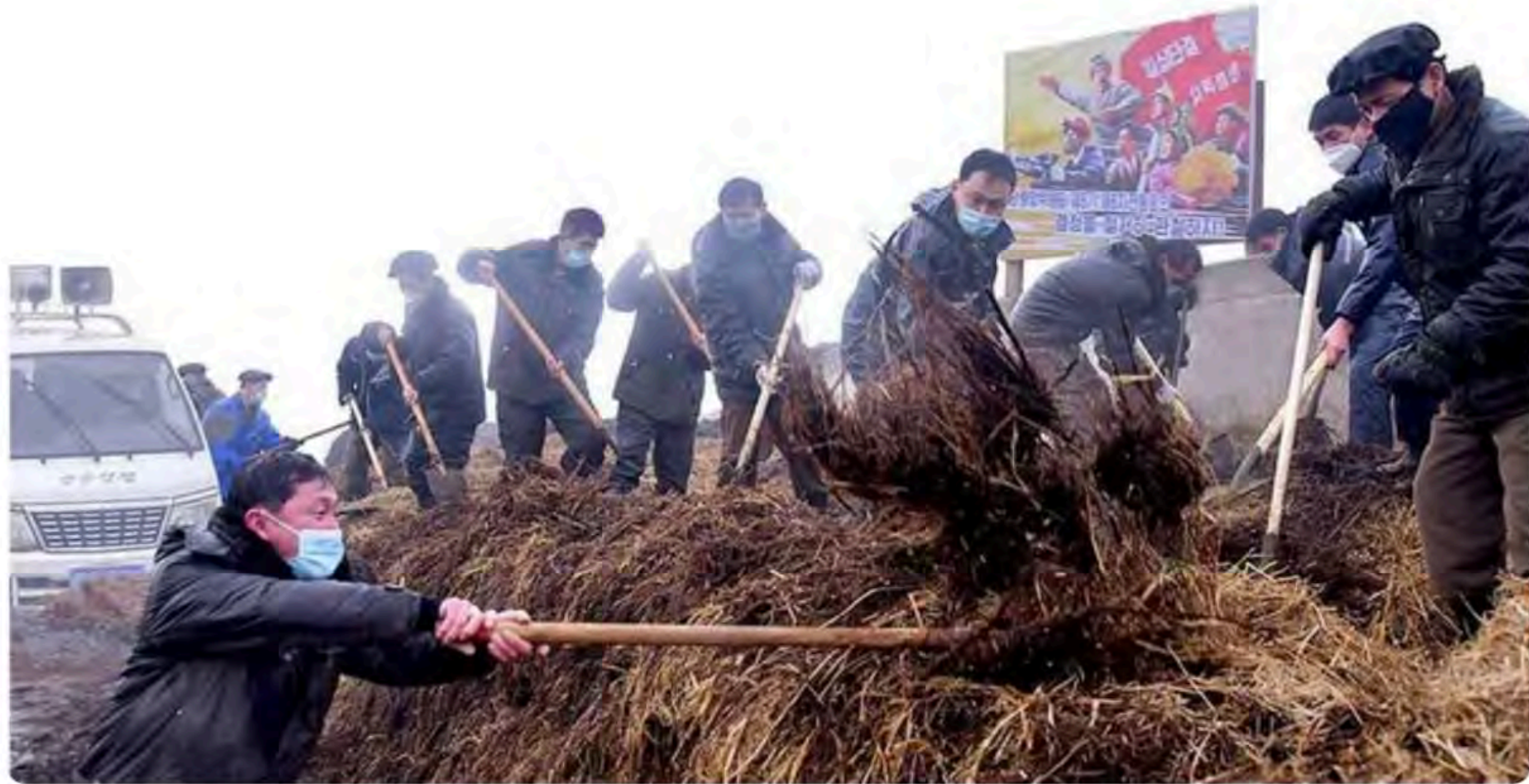
北韓全國堆肥長期短缺，政府強迫公民收集糞便，希望提高農作物產量。

[周刊王CTWANT] 北韓全國的堆肥長期短缺，政府因此強迫公民每年一月收集糞便，希望提高農作物產量，規定每個成年人必須貢獻500公斤的人類排泄物，每個學生則必須貢獻200公斤，但這遠遠超過了普通人一年產生的145公斤糞便，由於今年的配額高得令人難以置信，人民為了不受懲罰，開始互相偷竊或購買糞便，引發了不少衝突。